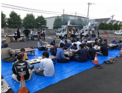
年に一度の懇親会