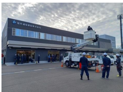
高所作業車訓練中