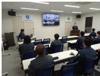
安全朝礼は欠かせません