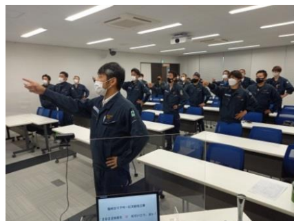
「今日もゼロ災でいこう、ヨシ！」